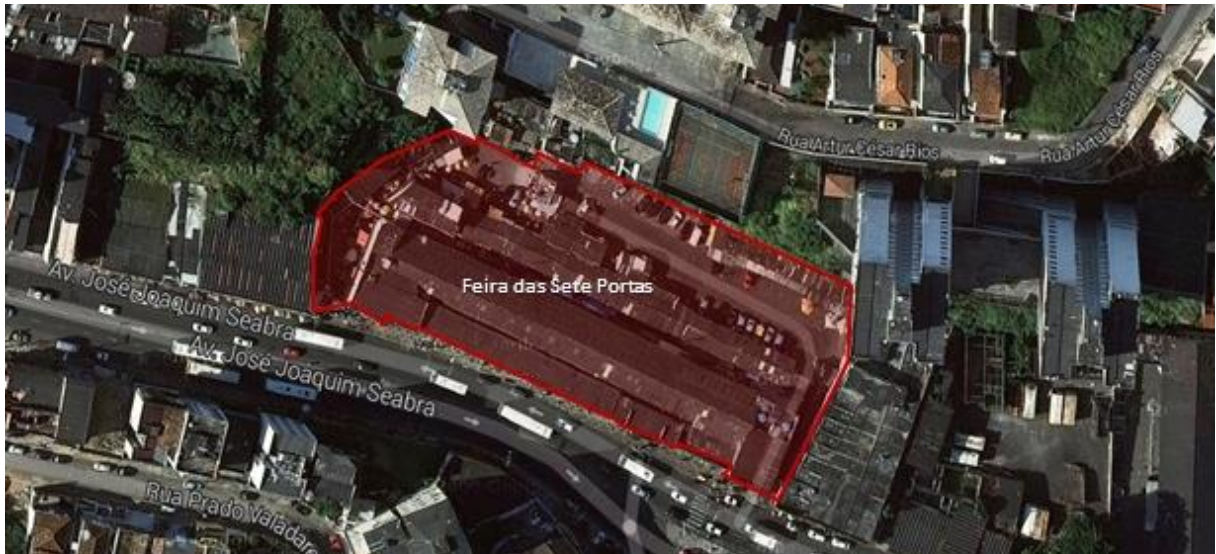
Figura 1: Demarcação espacial da Feira das Sete Portas.

Segundo DaMatta (1997), os espaços são invenções sociais e mesmo que demarcados por fronteiras, estas precisam ser legitimadas pela comunidade da propriedade privada e, acrescenta-se, pelos transeuntes. A construção da Feira impõe uma delimitação espacial que