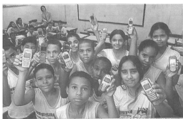
Imagem 05 Jornal O DIA 23/10/05